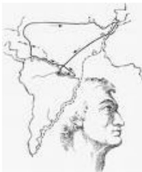
Bild över Vespuccis resor.