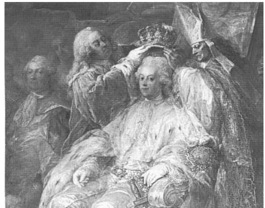
Gustav III: s kröning