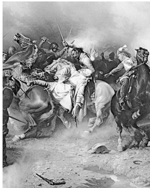
Slaget vid Lützen 1632