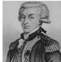
Lafayette (1754-1834) spelade stor roll i både det amerikanska och den franska revolutionen och hyllades som "två världars hjälte".