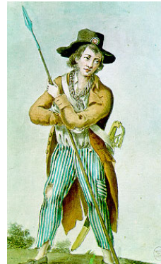
Vad var en Sanculotte?