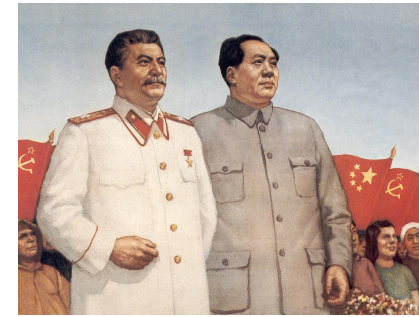
Stalin och Mao

Folkrepubliken Kina utropas av Mao tse-tung Kina blir ett kommunistiskt land med stöd från Sovjetunionen. En landreform kräver en miljon människoliv.