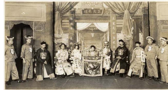
Kinas siste kejsare, den sexårige Puyi

Under 10-talet bildades Nationalistpartiet Guomindang. Förgrundsgestalt: Sun Yat-sen