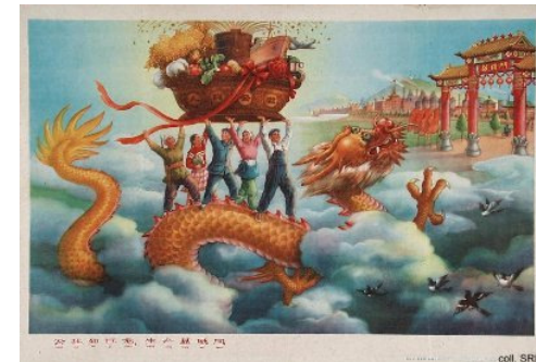
Propagandaaffisch från Det stora språnget

”Det stora språnget framåt” Med hjälp av den stora folkmassan skulle Kinas Jordbruk och industri ta ett stort steg framåt. Folkkommuner Kollektivjordbruk Hemmagjorda ugnar för stålproduktion Missväxt Språnget ledde till 20/30 miljoner kinesers död.