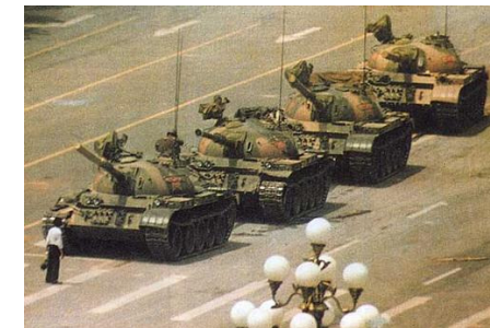
Känd bild från "Massakern vid Himmelska fridens torg"

1989 — Den demokratiska studentrörelsen krossas vid "Massakern vid Himmelska fridens torg".